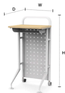
포디움 - 사이즈 : w520 D440 H1100 (mm)