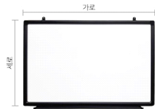
화이트보드 - 사이즈 : 1200*2400 (mm)