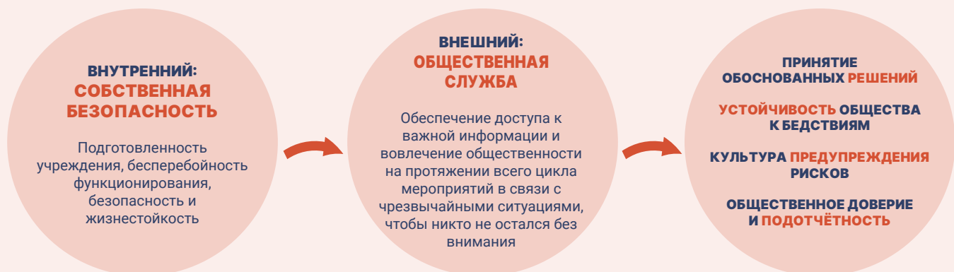
Рисунок 3 — Двойственный характер задач СМИ в связи с чрезвычайными ситуациями