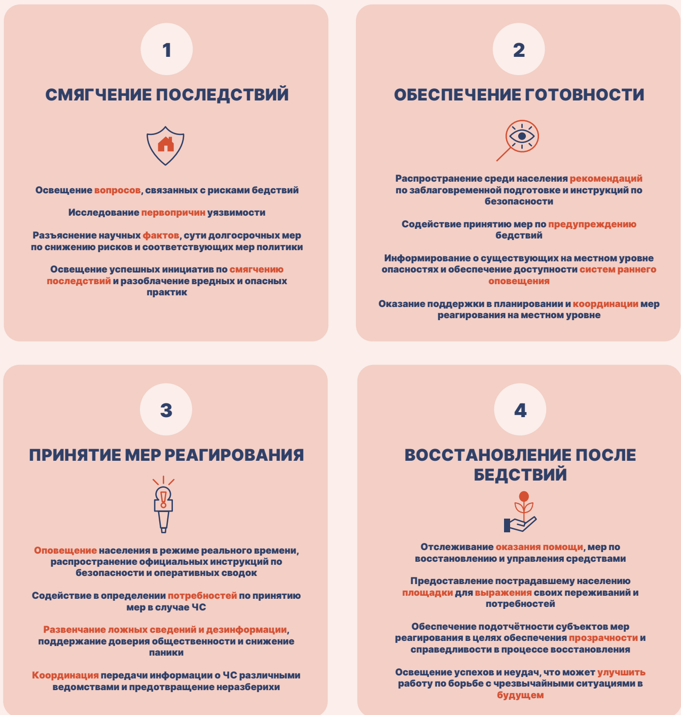
Рисунок 2 — Задачи СМИ в системе управления и снижения риска бедствий