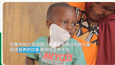
在塞内加尔 联合国儿童基金会通过帮助儿童获得营养的饮食来预防营养不良

点击链接观看视频： https://www.unicef.cn/videos/children-senegal-treated-malnutrition