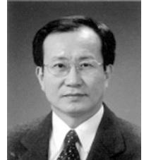
환경부 장관 이 치 범

한국환경생태학회 20주년과 녹색연합의 백두대간 보전운동 10주년을 기념하여 백두대간 보전운동의 역사와 성과, 한계 등을 점검하고 향후 보전방향을 정립하는 「백두대간의 어제와 오늘, 그리고 내일」 심포지엄이 개최되는 것을 진심으로 축하드립니다.