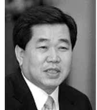
산림청장 서 승 진

오늘 한국환경생태학회, 녹색연합, 산림청 그리고 환경부가 공동으로 “백두대간의 어제와 오늘, 그리고 내일”이라는 주제를 가지고 백두대간 심포지엄을 갖게 된 것을 대단히 뜻 깊게 생각하며 수고해 주신 여러분께 감사드립니다.